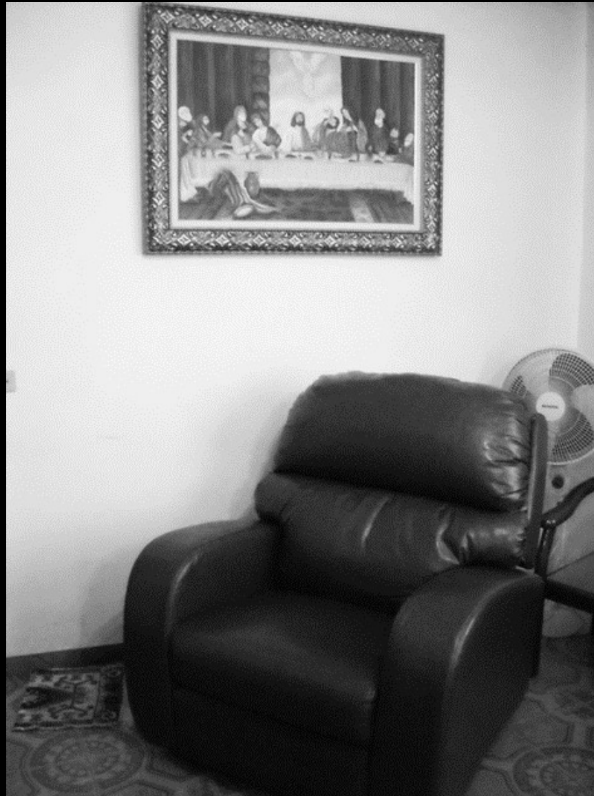
Osasco (Brasile), 2015