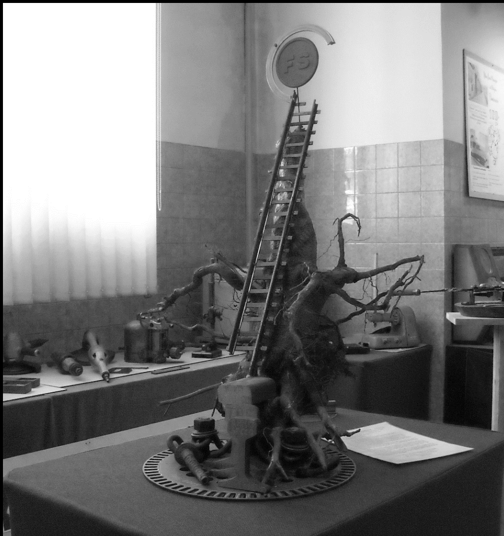
Museo OGR di Bologna, 2018