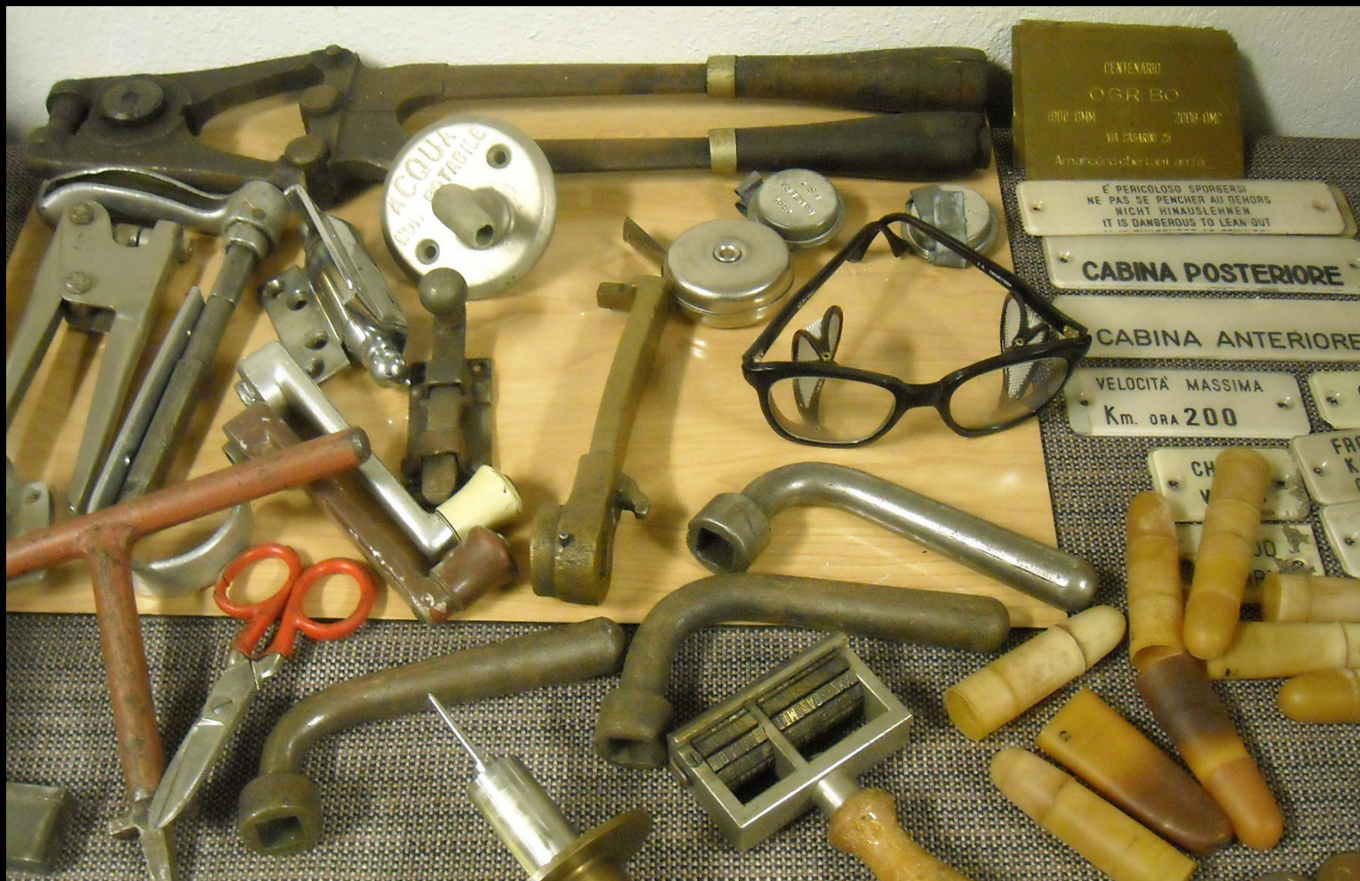
Museo OGR di Bologna, 2018