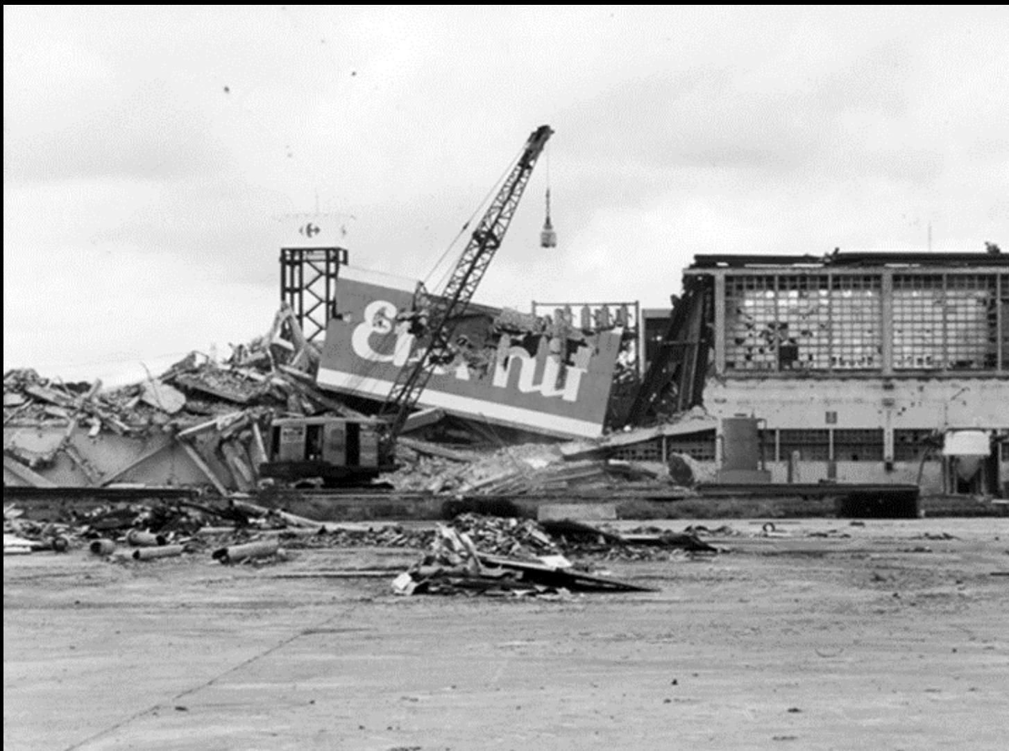
Osasco, 1995 Demolizione dello stabilimento Eternit