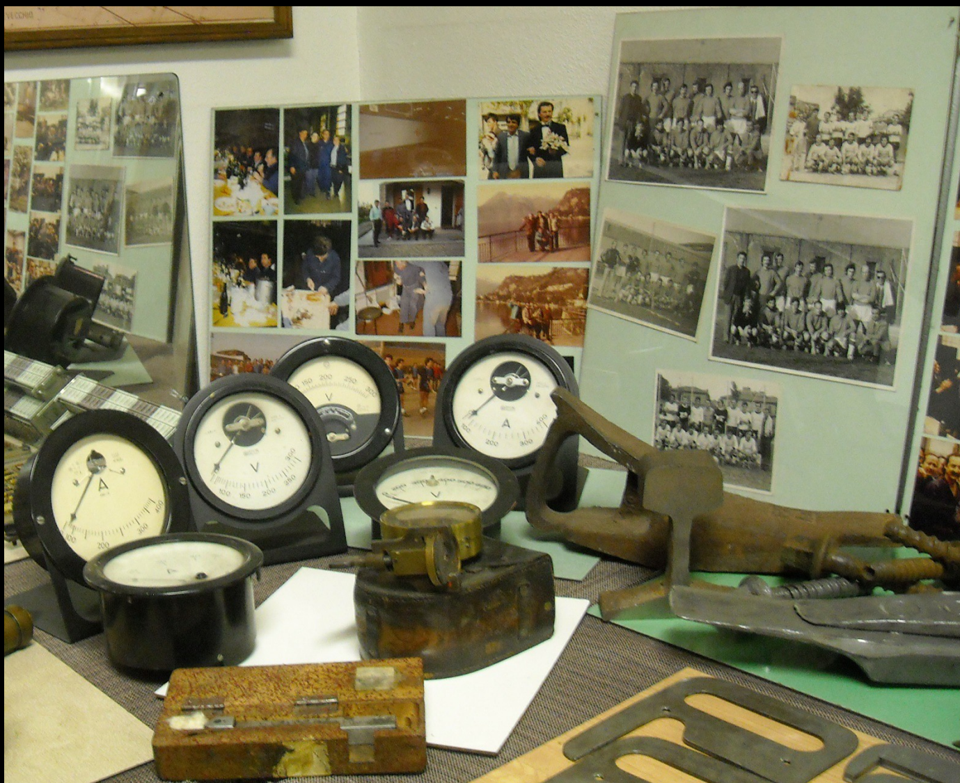
Museo OGR di Bologna, 2018