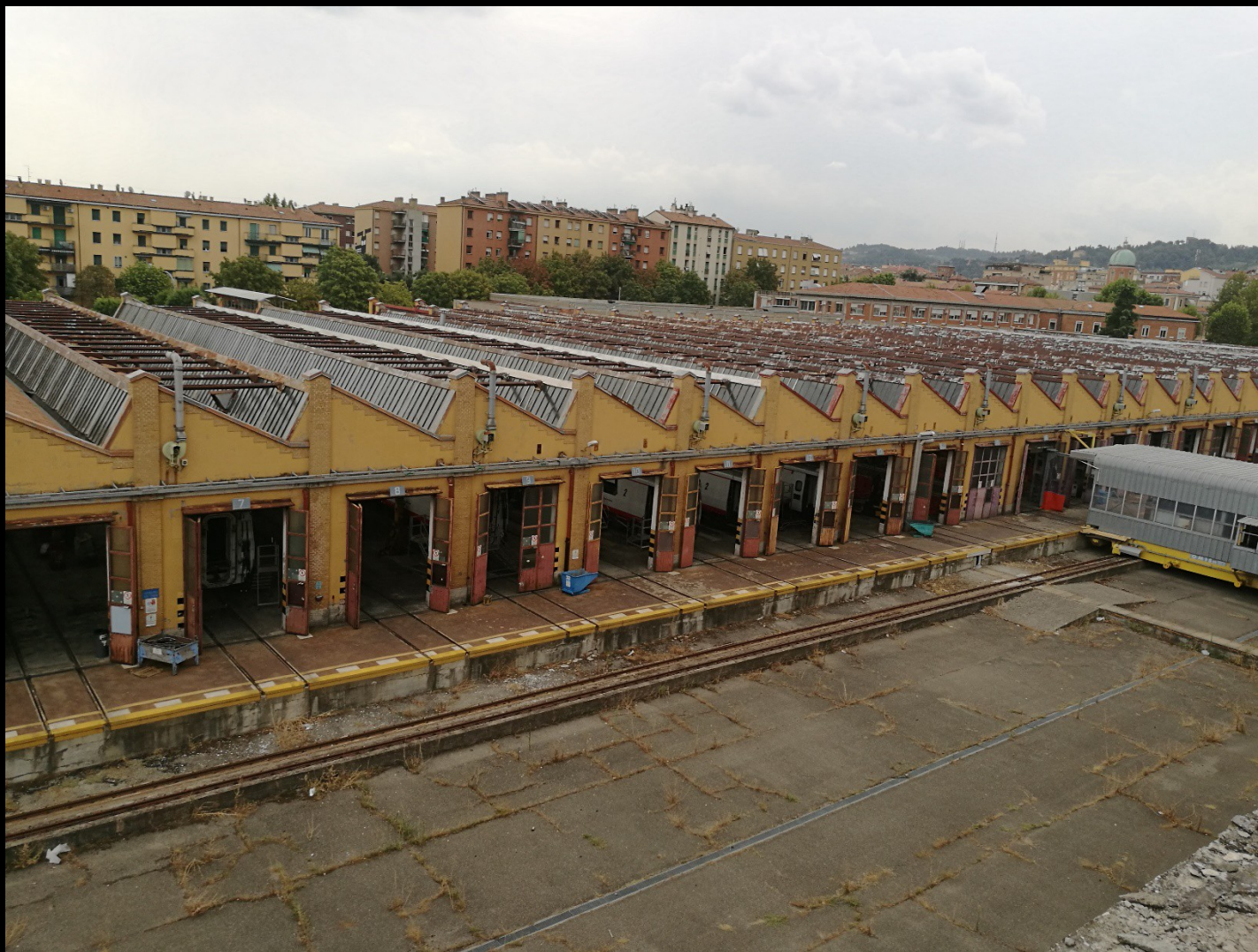
Stabilimento OGR di Bologna, i capannoni del 1908