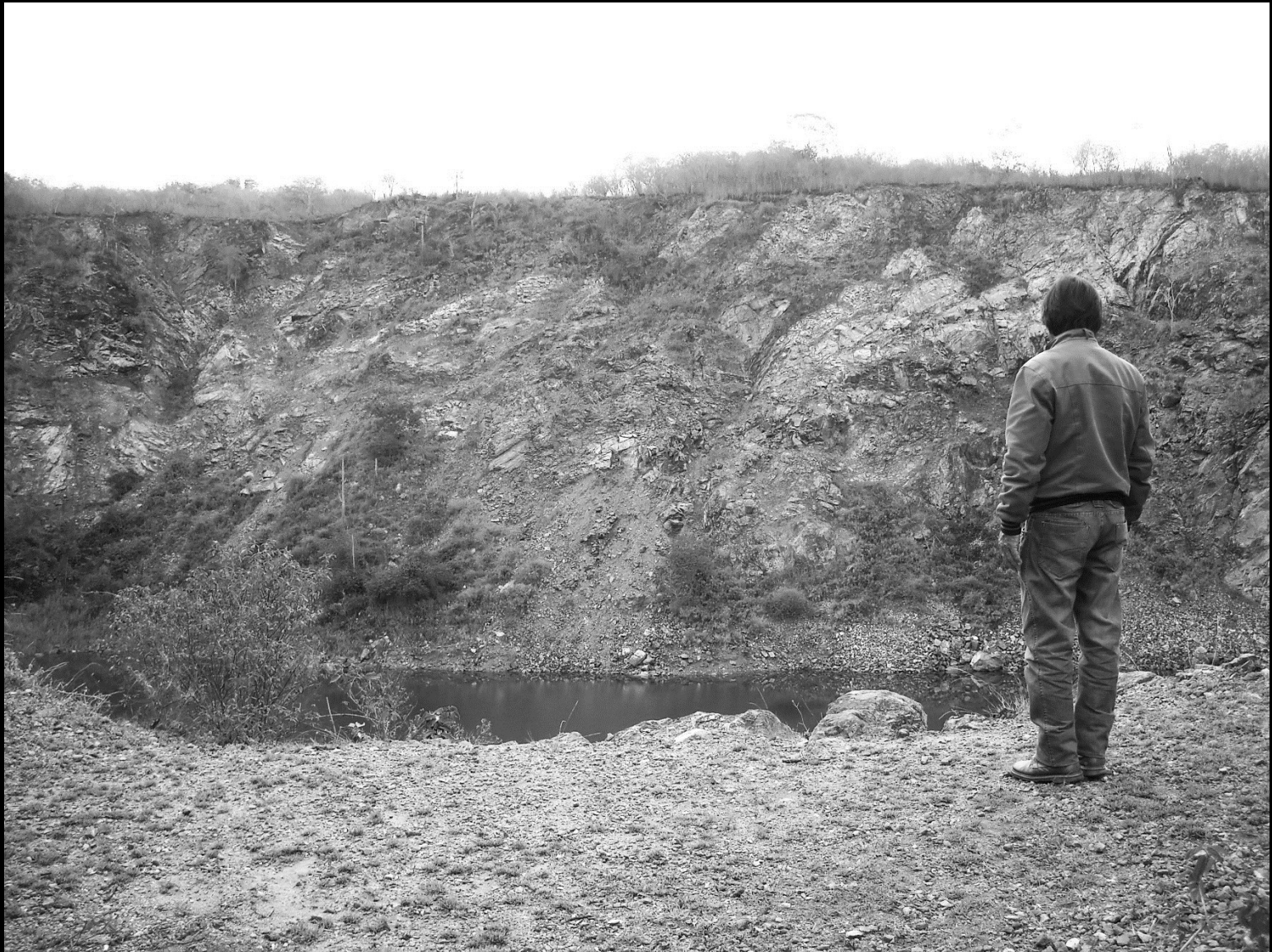
Miniera abbandonata di São Felix (Bahia, Brasile), 2015