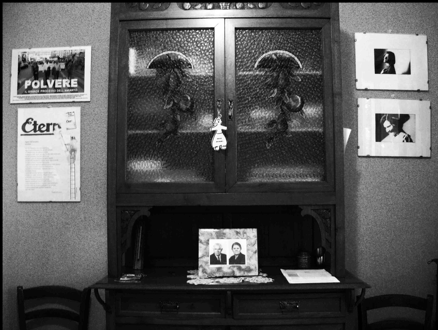
Casa di un'attivista AFeVA, Casale Monferrato, 2016